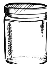
FRASCO GRANDE 350G $10.00 PESOS