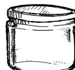
FRASCO MEDIANO 250G $10.00 PESOS